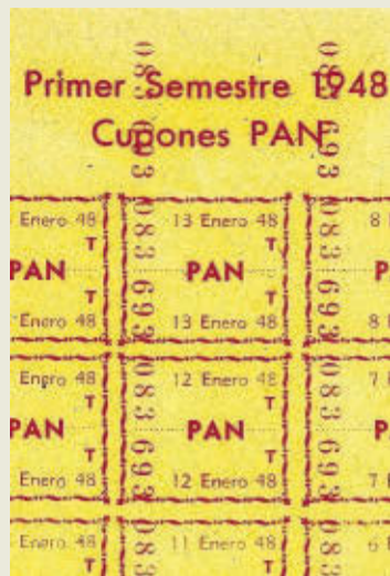
Cupón de racionamiento del 48.

Poder hornear su propio pan fue uno de los argumentos para la construcción del edificio de la cooperativa. Antes lo habían estado haciendo en un horno en la Plaça dels Sedassos. La entidad en algún momento también vendió al público y siempre procuró mantener regulado el precio del producto para las clases trabajadoras, lo que le causó numerosos encontronazos con el 'gremi de flequers'. El pan que se elaboraba en el edificio actual se repartía en burro por las casas de los socios.