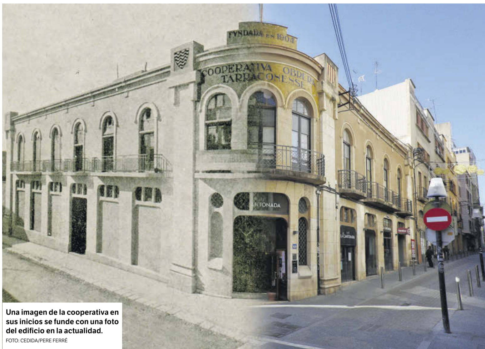
Una imagen de la cooperativa en sus inicios se funde con una foto del edificio en la actualidad.